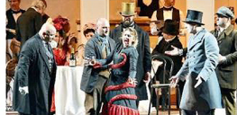
LIRICA Una scena de La Bohème, durante la quale è stato sperimentato per la prima volta il progetto di marketing territoriale di Valentini

Avviato il progetto "Lumen" del fotografo Carlo Valentini